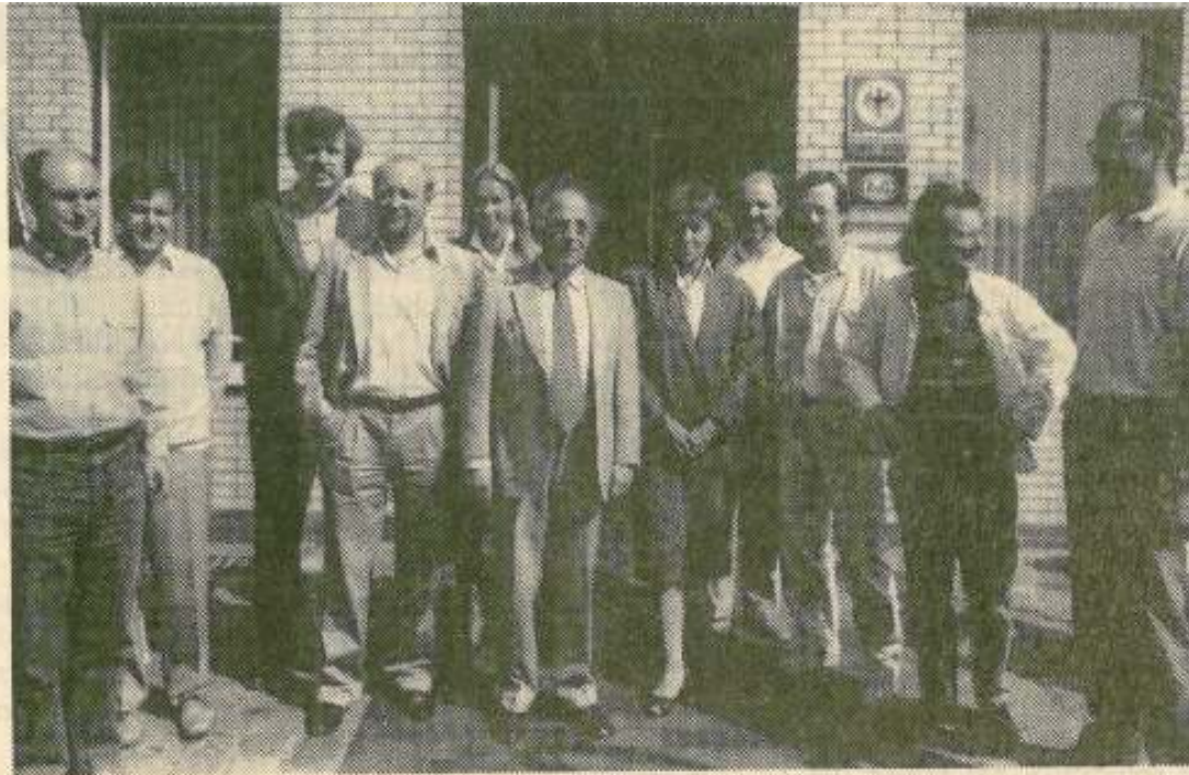
Elf der 14 Abiturienten des Reifeprüfungsjahrgangs 1968 während ihres Jubiläumstreffens vor dem Hotel zur Linde.